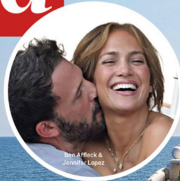
Ben Affleck & Jennifer Lopez

Heidi Klum Auf Capri feiert sie die Liebe – zu Hause wartet Ärger