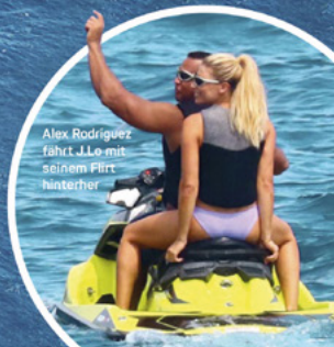
Alex Rodriguez fährt J.Lo mit seinem Flirt hinterher

J.LO & BEN AFFLECK schippen verliebt durchs Mittelmeer. Doch plötzlich taucht ihr Ex-Verlobter A-Rod auf