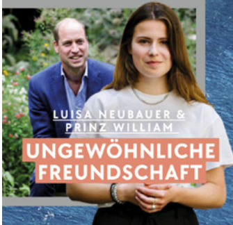
LUISA NEUBAUER & PRINZ WILLIAM

ANDIE MACDOWELL Graue Haare sind jetzt WOW!